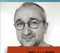
Olivier POG Auteur Série Les trappeurs de rien Editions La Gouttière