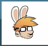
Thomas PRIOU Dessinateur Les lapins crétiens Editions Glénat Série Les trappeurs de rien Editions La Gouttière