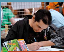
ONI-TETSUBO Auteur - Illustrateur manga La nouvelle classe de Lya Editions Kool Books